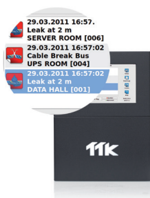
Fuites simultanées peuvent être détectées et affichées