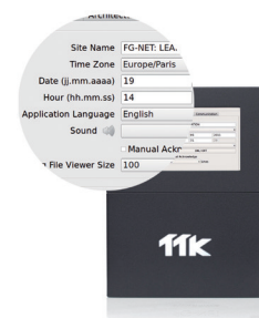
Interface utilisateur conviviale facilitant la configuration