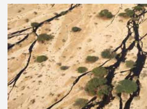
Fuite de pétrole dans la réserve naturelle d'Evrona.

Le système de détection de fuite d'hydrocarbures TTK destiné à l'industrie du pétrole et du gaz est spécialement conçu pour être installé dans des environnements variés, tels que les parcs de stockage, sur les canalisations, dans les aéroports et les raffineries. Le système est capable de détecter notamment l'essence, le fuel, le pétrole brut et le kérosène. La détection précoce associée à une localisation précise des fuites offertes par le système permet de réagir à un stade très précoce empêchant ainsi les dommages environnementaux.