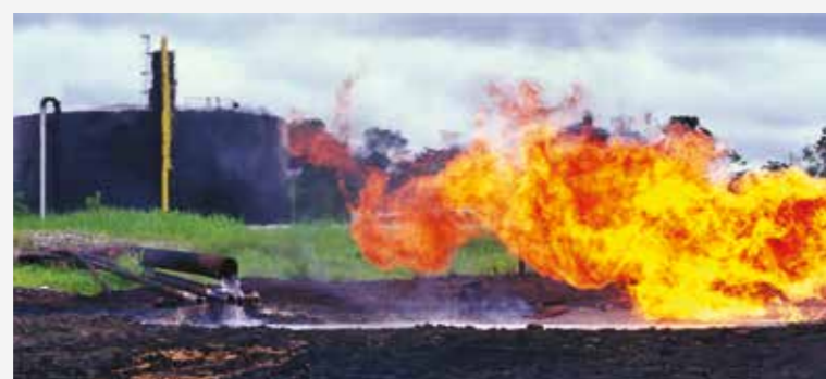
Pollution aquatique et du sol par hydrocarbures.