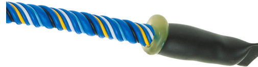
Câble détecteur FG-ECS côté terminaison