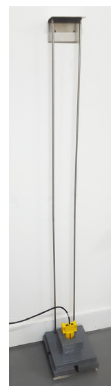
hauteur extensible : 1500mm