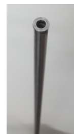
Hauteur réglable grâce à l'ajout de barres verticales ou à la coupe