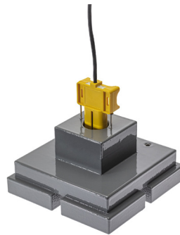
FG-FLOAT2 avec FG-ODP inséré

Un support-guide pour FG-FLOAT2 est disponible comme accessoire : FG-FLOATGUIDE. Plus de détails sur la page suivante.