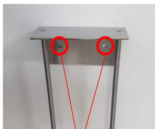
Orifices pour la fixation murale