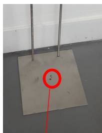
Orifices pour la fixation au sol