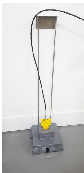
Hauteur standard : 850mm

La dimension d'un FG-FLOATGUIDE est de 220 (longueur) x 220 (profondeur) x 850 (hauteur) mm. Hauteur standard: 850 mm. La hauteur est extensible, par ex. à 1500 mm. Il est modulable sur place. Voir les schémas ci-dessous.