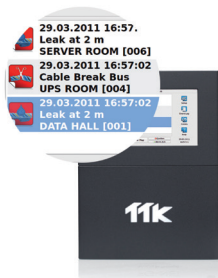
Fuites simultanées peuvent être détectées et affichées