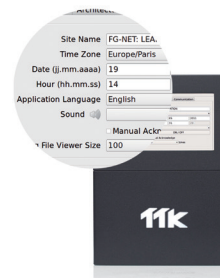
Interface utilisateur conviviale facilitant la configuration