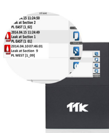
Fuites simultanées peuvent être détectées et affichées