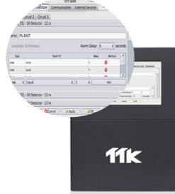
Configuration facile des relais sur chaque câble