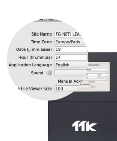
Interface utilisateur conviviale facilitant la configuration