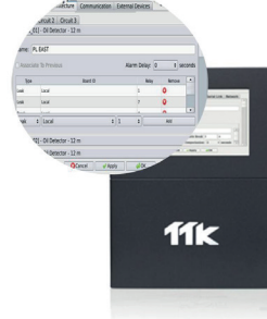
Configuration facile des relais sur chaque câble