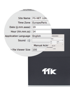
Interface utilisateur conviviale facilitant la configuration